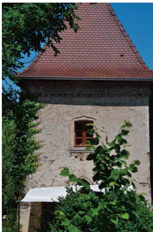
Fenêtre gothique, arcs brisés.

Le long du CD 19, l'éclairage sera modulé durant les heures creuses (23h-5h).