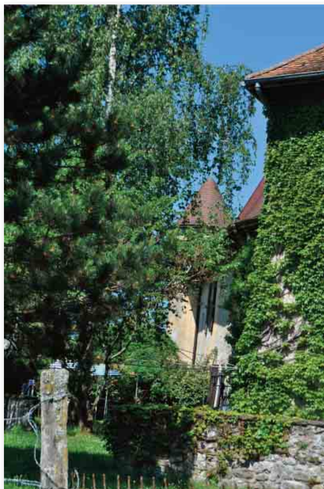
Entrée fortifiée par une double porte

Pour toutes explications et informations sur « Tea and Coffee » voir les sites www.arenthon.fr ou www.bm.arenthon.fr