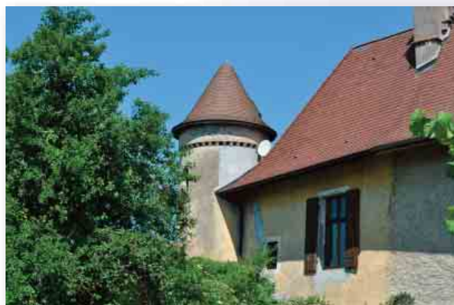
Tour ronde de défense.

cadre des objectifs du PLH (participation de 16 500 €, durée 2 ans, deux chantiers d'expérimentation, partenariat avec Innoval, communauté de communes Arve et Salève).